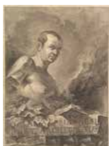
ジョヴァンニ・ バッティスタ・ ピラネージ (Giovanni Battista Piranesi, 1720-78)

イタリアの銅版画家、考古学者、建築家。ヴェネツィアの近くで生まれ、1740年にローマに居を定める。古代遺蹟に基づくローマのヴェドゥータやエジプト、エトルスクの古代建築図案等のエッチングは各国に伝えられ、新古典主義やロマン主義を培った。また室内調度の意匠は特にイギリス、フランスで尊重される。《牢獄》のシリーズはもっとも独創的な仕事とされ、空想上の牢獄を描いた幻想的な作品群は、多くの建築家、画家、文学者へ影響を与えた。